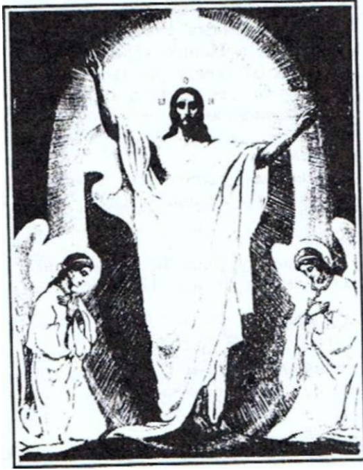
Уваскрасеньне Ісуса Хрыста